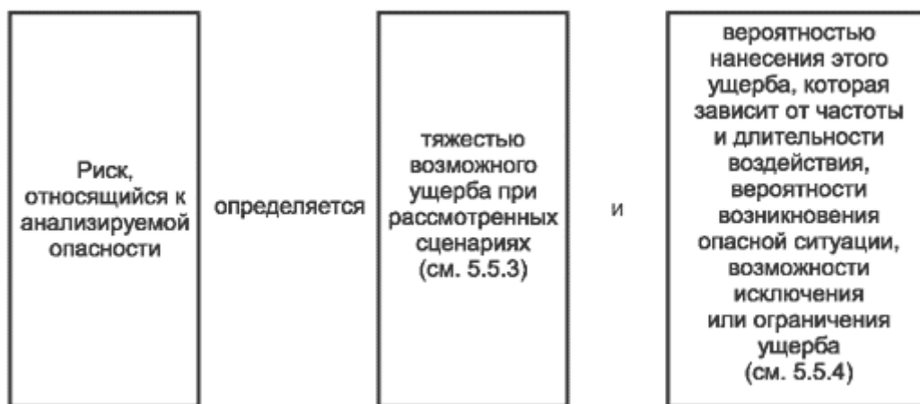
Рисунок 3 - Риск и его составляющие

Более подробно о составляющих риска и о процессе определения уровня тяжести возможного ущерба и уровня вероятности возникновения такого ущерба изложено в 5.5.3 и 5.5.4 соответственно.