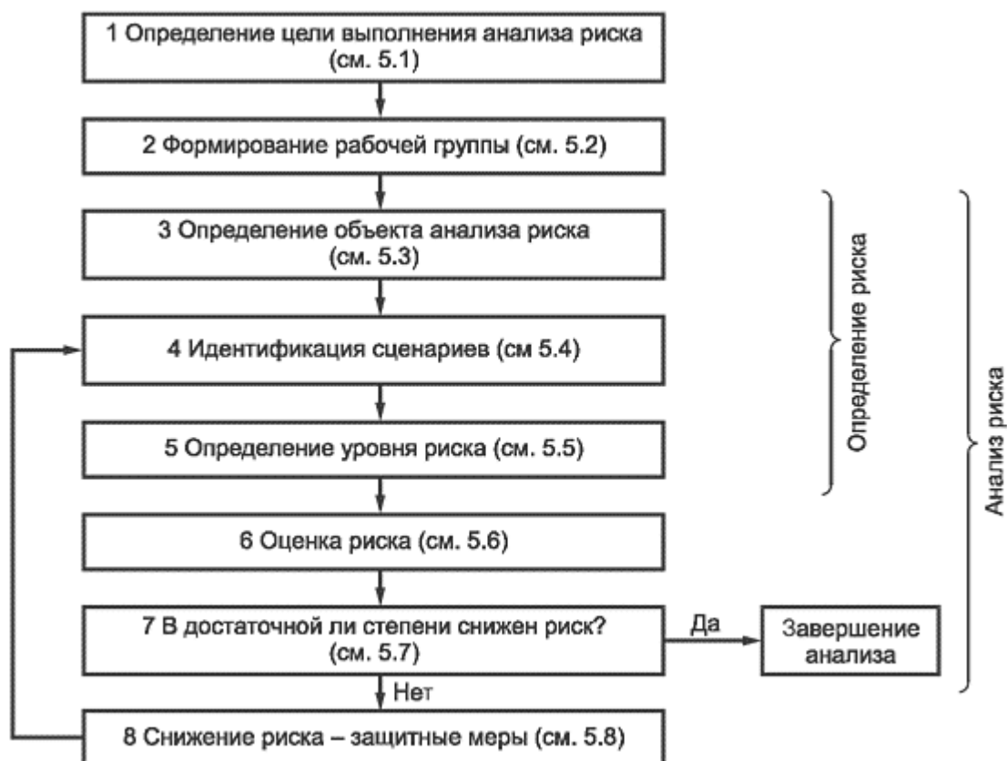
Рисунок 1 - Схема выполнения анализа и снижения риска